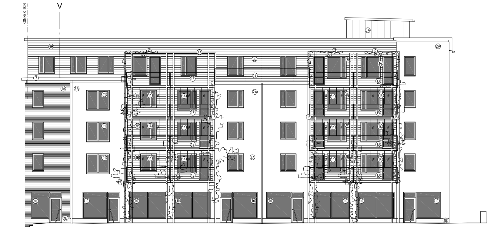
FASAD MOT SOCKERTORGET