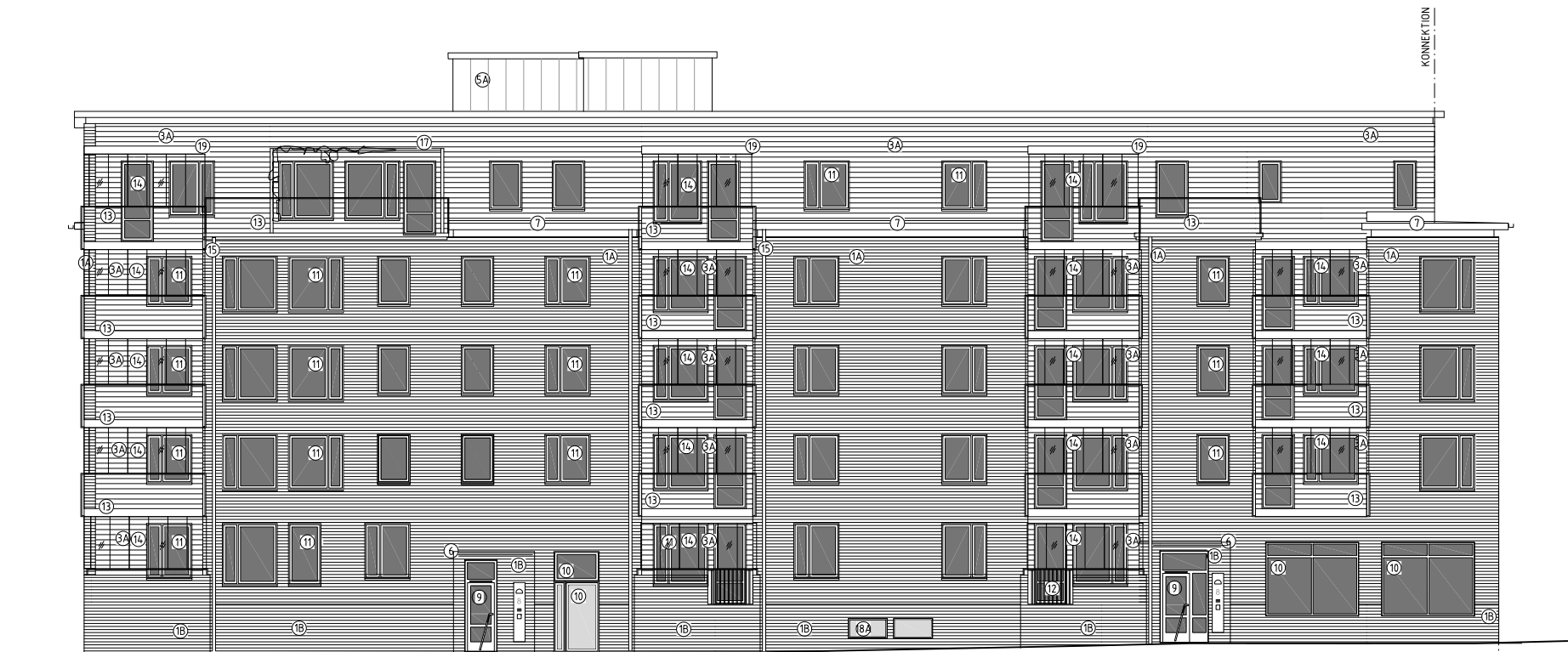
FASAD MOT FABRIKSGATAN